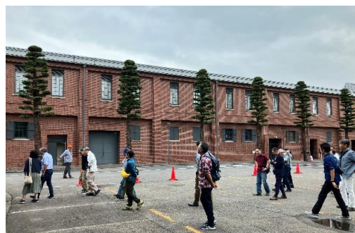
↑トヨタ産業技術記念館

そのあとは、浜焼きBBQで大いに飲食を楽しみました。 来年も必ず実施しますので、ご参加お待ちしております。